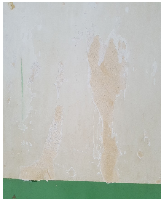
Descolamento da cerâmica da parede do banheiro masculino